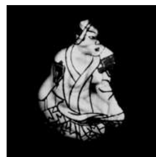
visuel tirage de tête

Ouvrage en couleurs bilingue français/anglais 96 pages 54 photos noir et blanc et couleur, 10 repros d'estampes 10 poèmes d'Ito Naga format 24x21cm à l'italienne Papier intérieur 150 gr reliure cartonnée cahiers cousus Imprimerie Escourbiac